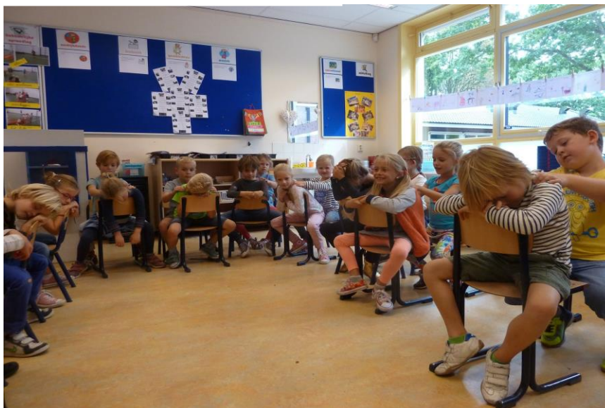
kanjerles in de middenbouw

Aan het einde van het jaar is geïnventariseerd tot hoever iedereen is gekomen. Dit is doorgegeven aan de volgende leerkracht zodat deze hiermee verder kan. Vanuit de kanjertraining wordt ook een kanjervolgsysteem aangeboden. Binnen de Radboudschool is gekozen voor dit leerlingvolgsysteem om de sociale ontwikkeling van kinderen te volgen, te weten Kanvas. Ook dit jaar is er 2 keer een afname moment geweest. Hiermee is de sociale ontwikkeling van kinderen in kaart gebracht en gevolgd..